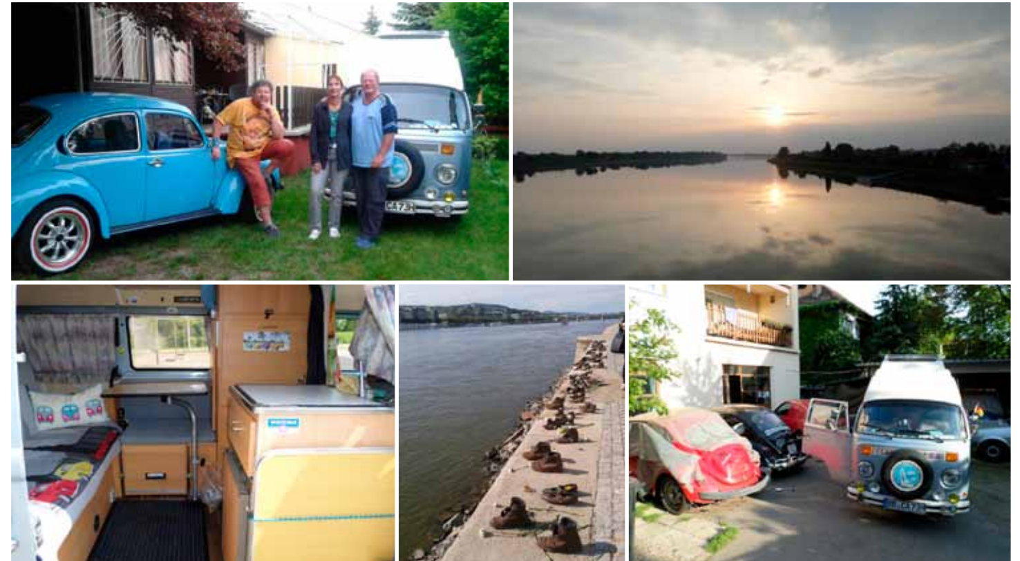
ÓRA SZERINT 324 EZER KILOMÉTERT MENT EDDIG AWESTI. ŐK 61 EZER KILOMÉ- TERT UTAZTAK BENNE. A 70 LÓERŐS LAKÓAUTÓ FELSZERELTSÉGHEZ TARTOZIK A HŰTŐ, TŰZHELY, MOSOGATÓ ÉS A TRUMA-ÁLLÓFŰTÉS. UTÓBBI -17 FOKOS KÜLSŐ HŐMÉRSÉKLET MELLETT IS +18-20 FOKOS KELLEMES KLÍMÁT BIZTOSÍTOTT BELÜL

az internet segítségével, fórumokat böngésznek, információkat szereznek az ADAC (német autókлуб) honlapjáról. Ettől függetlenül nagyon rugalmas az útvonal, mivel nem utaznak pontos ütemterv szerint. Ha akarják, spontán megváltoztatják a célállomást. Ha valahol tetszik, akkor ott tovább maradnak. Most, 2014-ben életük legnagyobb és leghosszabb utazását élik meg. A Duna forrásától indulva (Fekete-erdő, Németország) a Fekete-tengernél található Duna-deltáig mennek. Tulajdonképpen szerettek volna Odessza, Krim majd Kijeven át, Lengyelországon keresztül hazatérni, de ezt a jelenlegi ukrán helyzet miatt elvetették. Konstanzból délfelé veszik az irányt, s ellátogatnak Bulgáriába, Szófiába, majd tovább délre, Görögországba. Thessalonikiból nyugatra mennek, dél Albánián keresztül az Adriához, ahol komppal kelnek át Olaszországba. Úgy számolnak, hogy 2014 november közepén érkehetnek haza Németországba. Így lesznek úton 7 hónapot egyhuzamban, de már azt is tudják, hogy Karácsony előtt újra elindulnak: Francia-, majd Spanyolországon keresztül Marokkóba. Karácsonykor – összekötve a kellemes hasznossal – az Ibériai-félszigeten találkoznak a gyermekeikkel. „Ez az egész egy nagy kaland, amikor minden újat be kell fogadni. Persze ha nem vagy képes sokáig élni egy szűk helyiségben, akkor jobb, ha el sem indulsz egy ilyen útra.” magyarázza Colette, majd hozzáteszi: „Európai utazásunk mottója: